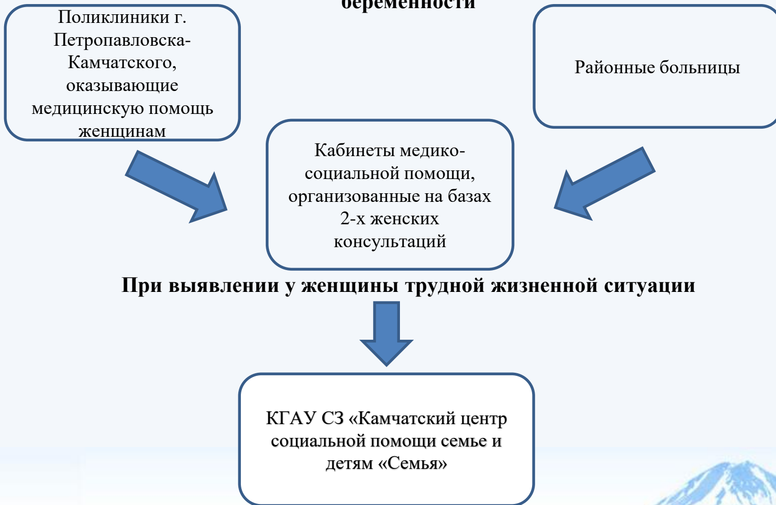
Схема взаимодействия женских консультаций с социальными службами при организации работы с женщинами и семьями, желающими иметь ребенка, а также с женщинами, обратившимися в медицинскую организацию для прерывания беременности