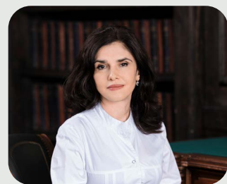
ДРАПКИНА ОКСАНА МИХАЙЛОВНА

Директор ФГБУ «НМИЦ ТПМ» Минздрава России, Президент РОПНИЗ, Член-корреспондент РАН